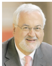
Peter Harry Carstensen Ministerpräsident des Landes Schleswig-Holstein

Mein Dank gilt der Stiftung "Schleswig-Holsteiner Stiftungstag", die diese Veranstaltung aus der Taufe gehoben hat. Möge der Stiftungstag 2006 dazu beitragen, den Stiftungsgedanken mit seinen vielfältigen Möglichkeiten der Hilfe und Unterstützung zu verbreiten und den Bürgersinn in unserem Land weiter zu stärken.